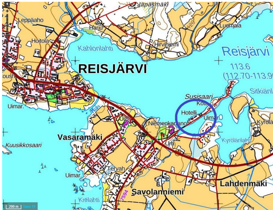
ALUEEN YLEISSIJAINTI. MUUTOSALUE SINISEN YMPYRÄN SISÄLLÄ

Kaavoitustyön tarkoituksena on muuttaa asemakaavaa siten, että alueella toimivan matkailuyrityksen toiminnan ja jatkorakentamisen toteuttaminen on mahdollista ja tarkoituksenmukaista. Alueen yleissijainti ja voimassa oleva kaava ovat oheisilla kartoilla.